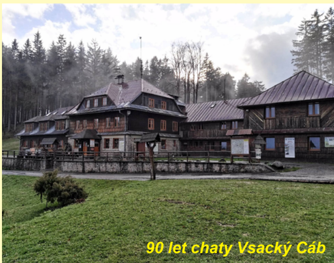
90 let chaty Vsacký Cáb