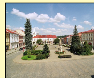
náměstí Valašské Meziříčí